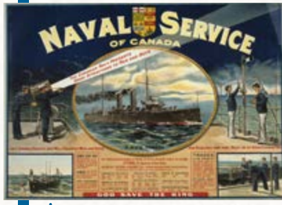
▲ Affiche de recrutement pour le service naval au Canada, v. 1915.

1910 La Loi du service naval crée la Marine royale canadienne . Tentant de trouver un équilibre entre la pression impérialiste et les inquiétudes des Canadiens français nationalistes, Laurier crée une marine volontaire dont la flotte pourrait être mise à la disposition de la Grande-Bretagne en cas de crise majeure.