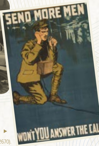
Affiche de recrutement, le Comité central de recrutement de Toronto, No. 2 Division militaire, 1915.

1919 Alors qu'il reconstruit le Parti libéral, Laurier meurt à Ottawa le 17 février. Plus de 100 000 personnes assistent à ses funérailles. Comme l'a écrit son adversaire Henri Bourassa : « Les vertus personnelles de cet homme d'État éminent, ses qualités de cœur admirables, cette charité modeste infatigable, l'immense dignité de sa vie, sont des causes de confiance et de réconfort pour tous ceux qui l'ont aimé ».