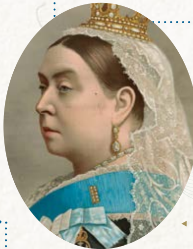
La reine Victoria vers la fin des années 1800.

Dans le cadre des célébrations du jubilé de diamant de la reine Victoria, Laurier participe à la première conférence impériale à grande échelle à Londres. Le 21 juin, Laurier accepte avec réticence le titre de chevalier, devenant « Sir » Wilfrid Laurier.