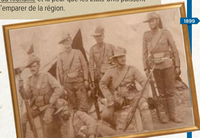
Des Canadiens sur le veld en Afrique du Sud durant la guerre des Boers.

L'Acte du territoire du Yukon sépare le Yukon des Territoires du Nord-Ouest. Cette action est motivée par l'augmentation de la population durant la ruée vers l'or du Klondike et la peur que les États-Unis puissent vouloir s'emparer de la région.