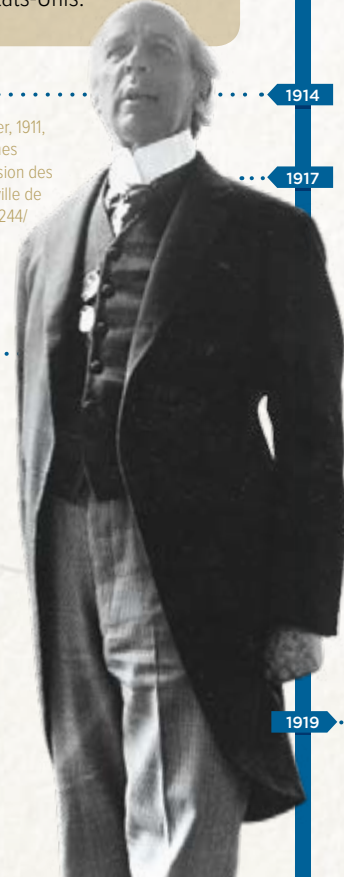
Sir Wilfrid Laurier, 1911

1917 La Loi du service militaire met en place la conscription (service militaire obligatoire), provoquant une crise nationale. Borden crée un gouvernement de coalition unioniste qui attire les libéraux qui sont pour la conscription dans son parti, mais Laurier refuse de se joindre à la nouvelle administration. Il mène le Parti libéral, gravement réduit, à l'élection fédérale du 17 décembre, ne remportant que 82 sièges, dont seulement 20 sont situés à l'extérieur de la province du Québec.