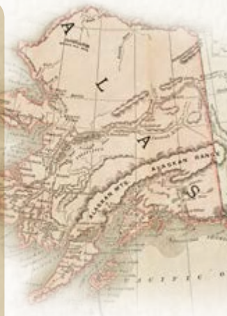
▲ Carte montrant la frontière d'Alaska entre les États-Unis et le Canada, v. 1890.

1903 Le conflit concernant les frontières de l'Alaska est réglé. Le Canada voulait une route entièrement canadienne des champs d'or du Klondike jusqu'au Pacifique, en passant à travers la bande côtière de l'Alaska, sur laquelle les États-Unis revendiquaient la souveraineté. Un tribunal de six hommes (le Canada ayant deux votes, les États-Unis, trois, et la Grande-Bretagne, un) se prononce en faveur des États-Unis avec le soutien du membre britannique, Lord Alverstone, qui veut éviter un conflit militaire. Laurier regrette que le Canada n'ait pas le pouvoir de prendre ses propres décisions internationales.