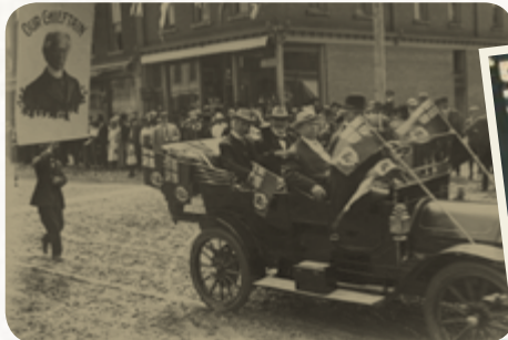
▲ Laurier lors d'un défilé à Simcoe, Ont., v. 1910.

1911 Laurier est attaqué de tous les bords pendant la campagne des élections fédérales : au Québec, on craint que l'initiative concernant la marine conduite à participer aux initiatives militaires de la Grande-Bretagne; au Canada anglais, les craintes se regroupent autour de la question de l'accord de réciprocité. Les longues années de Laurier au pouvoir, avec leurs problèmes inévitables et leurs compromis, contribuent à sa défaite au profit des conservateurs de Robert Borden le 21 septembre.