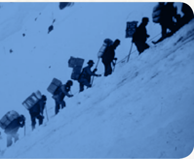
Des prospecteurs montent le col Chilkoot, C.-B., en route vers les champs d'or du Klondike, v. 1898-1899.

La découverte d'or le long d'un affluent de la rivière Klondike, en août, pousse les gens à se précipiter au Yukon dans l'espoir d'y faire fortune.