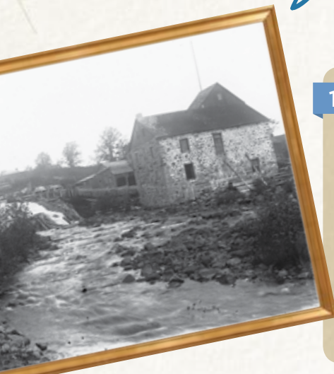
▲ Un moulin et une chute d'eau à New Glasgow, Qc, v. 1900.

Cette ligne du temps accompagne le guide pédagogique Sir Wilfrid Laurier de Historica Canada.