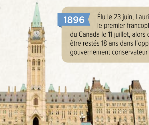
Le Parlement du Canada.

Élu le 23 juin, Laurier devient officiellement le premier francophone premier ministre du Canada le 11 juillet, alors que les libéraux, après être restés 18 ans dans l'opposition, défont un gouvernement conservateur post-Macdonald épuisé.