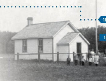
École près de Brandon, Man. v. 1900-1910.

La législature du Manitoba abolit le français comme langue officielle. Cédant à la pression du public, la province adopte aussi deux lois qui fusionnent les systèmes scolaires catholique et protestant en un seul système public. Cela mène à une crise politique connue sous le nom de Question des écoles du Manitoba .