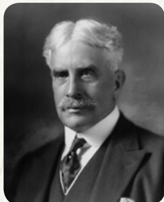
▲ Sir Robert Borden, Montréal, v. 1911-1920.

1908 Laurier mène les libéraux à une quatrième victoire électorale le 26 octobre.