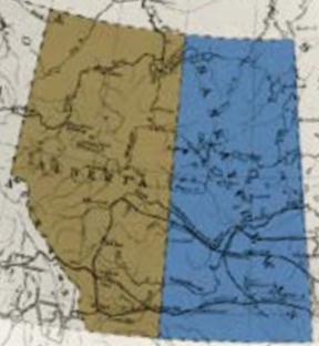
▲ Le Canada en 1906.

1900 Laurier mène les libéraux à la victoire lors des élections fédérales du 7 novembre.