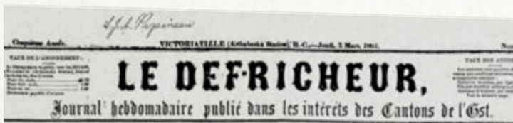
▲ Le Défricheur , 7 Mars 1867. Laurier a publié le journal de novembre 1866 jusqu'à sa fin le 21 mars 1867.

1866 Il devient rédacteur du journal Le Défricheur . Il est anti-Confédération, redoute la centralisation politique et l'assimilation des catholiques français dans la nation anglaise protestante.