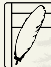
Création en forme de symbole

Matériels et techniques suggérés : acrylique, gravure (pochoir, softoleum), crayon, transfert, techniques mixtes.