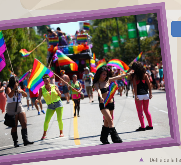
▲ Défilé de la fierté à Vancouver

Créez une « visite guidée » dans votre classe. Demandez aux étudiants de partager les résultats de leur recherche dans différentes stations à travers la classe. Les enseignants peuvent filmer les étudiants faisant une présentation vidéo individuelle à propos de ce que la diversité au Canada signifie pour eux, incorporant ce qu'ils ont appris à propos de leur sujet.