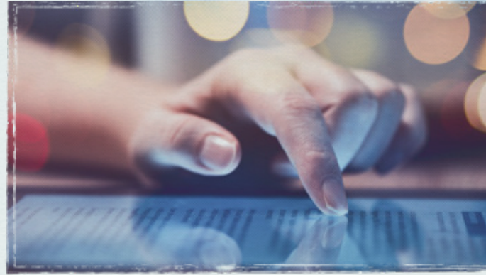
▲ Une femme lit sur une tablette.