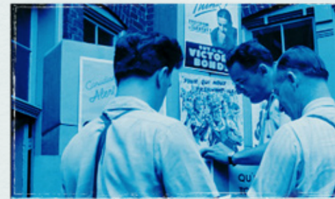
▲ Des hommes entourés d'affiches de propagande.

CONSEIL AUX ENSEIGNANTS : Encouragez les élèves à ajouter des termes supplémentaires au mur de mots tout au long des activités de ce guide.