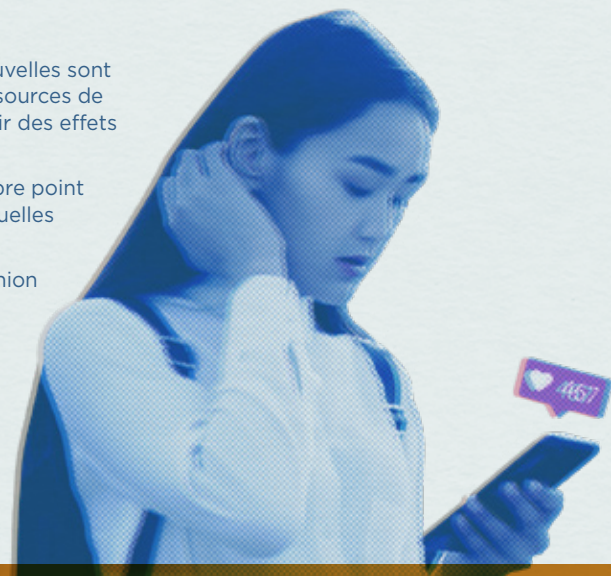
▲ Jeune femme utilisant les médias sociaux sur son téléphone intelligent.