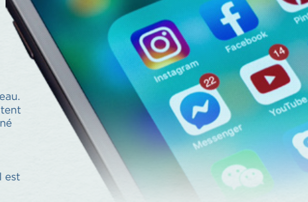
▲ Écran d'accueil d'un téléphone intelligent avec des applications de médias sociaux.

MODIFICATION : En travaillant en paires, complétez un tableau S-V-A avant et après le visionnement de chaque vidéo. Après avoir regardé les vidéos, discutez avec la classe des questions qui demeurent.