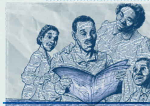
▲ Une famille noire de l'Oklahoma lit le journal (Image de « Les meilleures terres nouvelles de l'Ouest », Historica Canada, 2019).