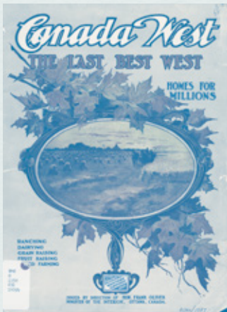
« Canada West: The Last Best West » : Couverture d'un prospectus sur l'Ouest canadien, produit par le ministère de l'Intérieur, 1909.