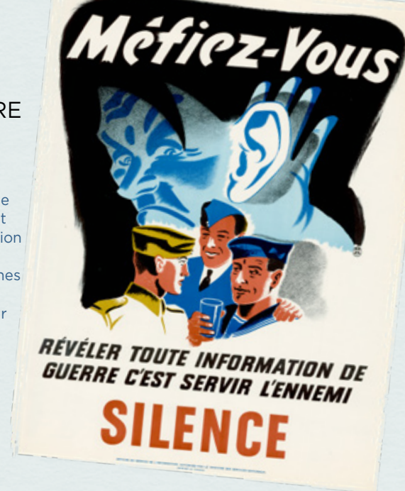
Affiche de propagande de la Deuxième Guerre mondiale.

APPROFONDISSEMENT : Ayez une discussion de classe au sujet des similarités et des différences entre la propagande d'aujourd'hui et celle de la Deuxième Guerre mondiale. D'où la propagande d'aujourd'hui provient-elle? Vers qui est-elle dirigée, et quel en est le but? Comment est-elle propagée?