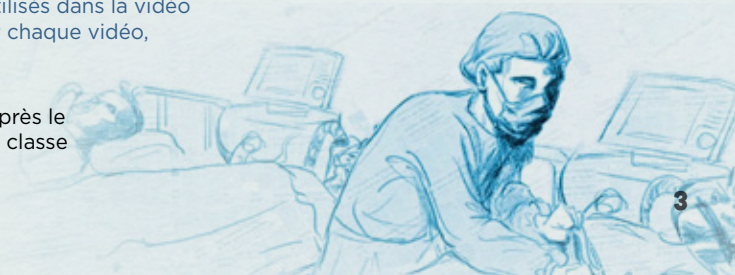
▼ Un employé d'hôpital traite des patients atteints du SRAS (Image de « L'épidémie de SRAS », Historica Canada, 2019).