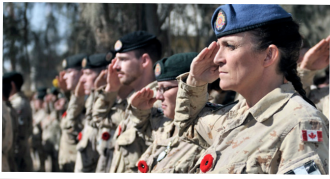
▲ Des membres du groupement tactique du 1 er Bataillon, The Royal Canadian Regiment, assistent à une cérémonie du jour du Souvenir, 2010.