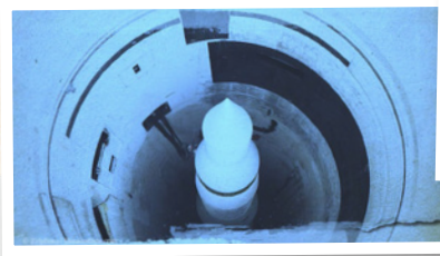
Image extraite de États de service : La Guerre froide (Historica Canada).

Une des voies qui se sont ouvertes aux femmes à cette période était le maintien de la paix, qui est le terme donné aux opérations militaires des Nations Unies dans des pays affectés par un conflit. Les Casques bleus travaillent à maintenir la paix et la sécurité, à protéger les droits de la personne et à aider à rétablir l'État de droit. En 1956, Lester B. Pearson, qui était alors ministre des Affaires étrangères du Canada, a placé le Canada dans un rôle de leadership avec les Nations Unies durant la crise du canal de Suez. En raison du rôle important de Pearson dans la crise, ainsi que celui du Canada dans la Force d'urgence des Nations Unies qu'il a aidé à créer, plusieurs Canadiens considèrent le maintien de la paix comme une partie de l'identité du pays. Le maintien de la paix allait devenir un élément clé du portfolio militaire du Canada.