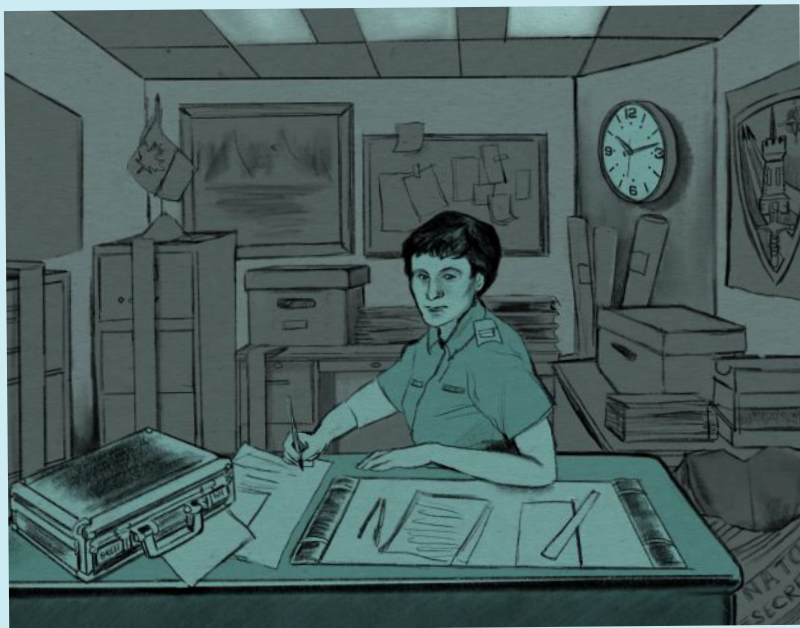
Image extraite de Le Canada et la guerre du Golfe : dans leurs propres mots (Jessie Durham/Historica Canada).