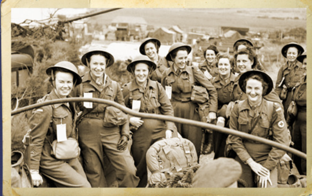
Des infirmières arrivent à l'étranger, France, 1944.

Cette trousse a été produite par le Projet Mémoire et Historica Canada avec le soutien généreux du gouvernement du Canada. Une initiative de Historica Canada, le Projet Mémoire est un bureau d'orateurs bénévoles qui organise des rencontres afin de permettre aux anciens combattants et aux membres actifs des Forces armées canadiennes de partager leurs récits de service militaire dans des écoles et événements communautaires à travers le pays. Réservez la visite d'un orateur au leprojetmemoire.com/reserver-un-orateur/ . Historica Canada offre des programmes que vous pouvez utiliser afin d'explorer, d'apprendre, et de réfléchir à notre histoire et à ce que signifie le fait d'être Canadien. Visitez notre site web au historicanada.ca/fr .