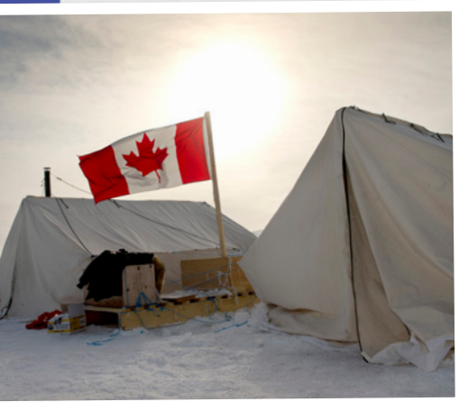
Des Rangers canadiens dressent un campement temporaire avec des tentes McPherson doublées sur l'île Sherard Osborn, au cours de leur patrouille dans l'Arctique, le 14 avril 2013, dans le cadre de l'opération Nunalivut.