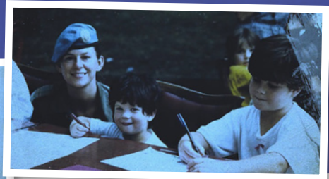
Image extraite de États de service : Opérations de paix (Historica Canada).